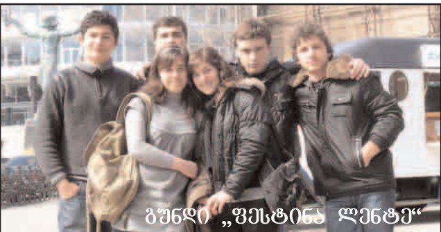
გუნდი „ფესტინა ლენტი“